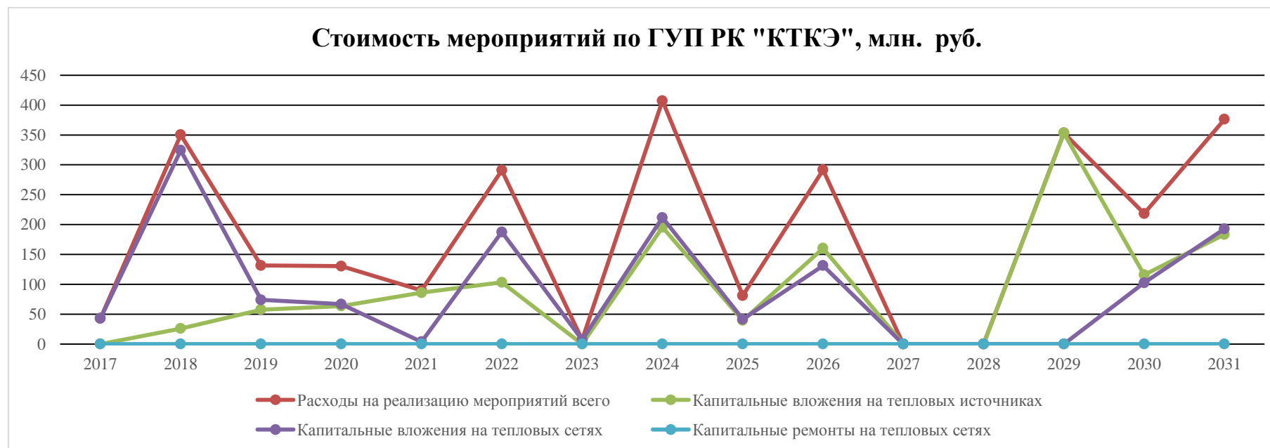
Рисунок 2 – Стоимость мероприятий, предусмотренных для ГУП РК «КТКЭ» г. Евпатория